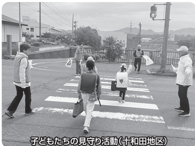
子どもたちの見守り活動(十和田地区)