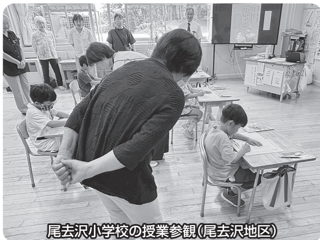
尾去沢小学校の授業参観(尾去沢地区)