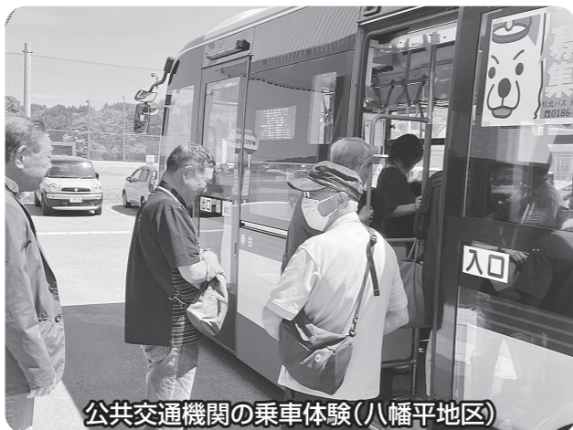
公共交通機関の乗車体験(八幡平地区)