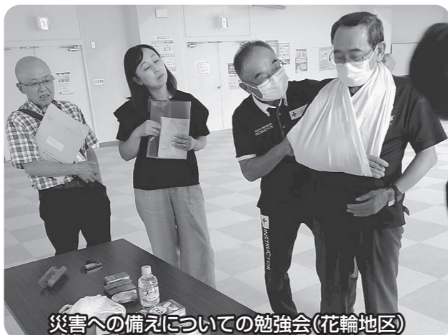
災害への備えについての勉強会(花輪地区)