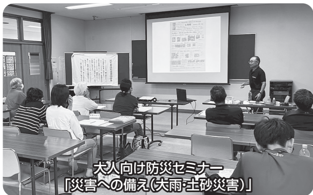
大人向け防災セミナー 「災害への備え(大雨・土砂災害)」