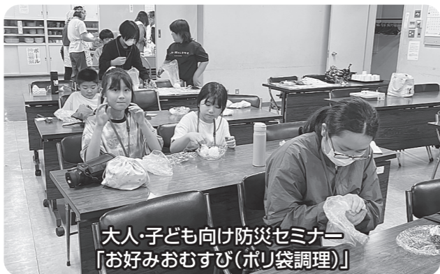
大人・子ども向け防災セミナー 「お好みおむすび(ポリ袋調理)」