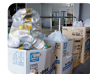
アルミ缶回収の様子

アルミ缶回収活動に力を入れており、昨年度のシルバーカーに引き続き、今年度は自走式車いすを1台寄付して頂きました。花輪中学校の皆さん、温かい善意ありがとうございます。