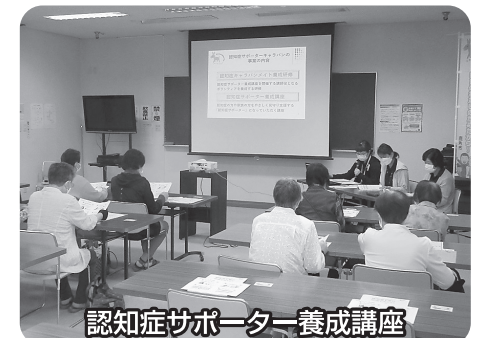
認知症サポーター養成講座