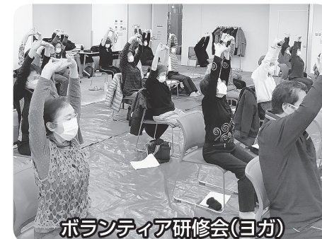
ボランティア研修会(ヨガ)