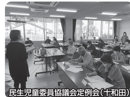
民生児童委員協議会定例会(十和田)

経済的な相談等、相談者の自立に向けて、関係機関と連携し、伴走型の支援を行います。