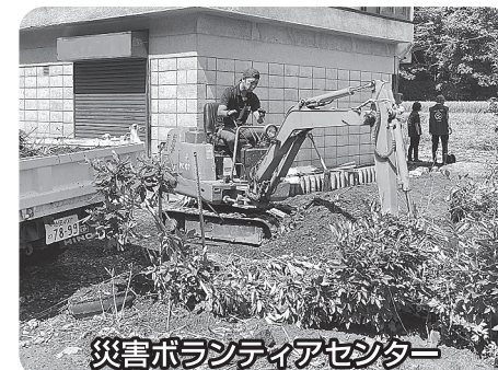
災害ボランティアセンター