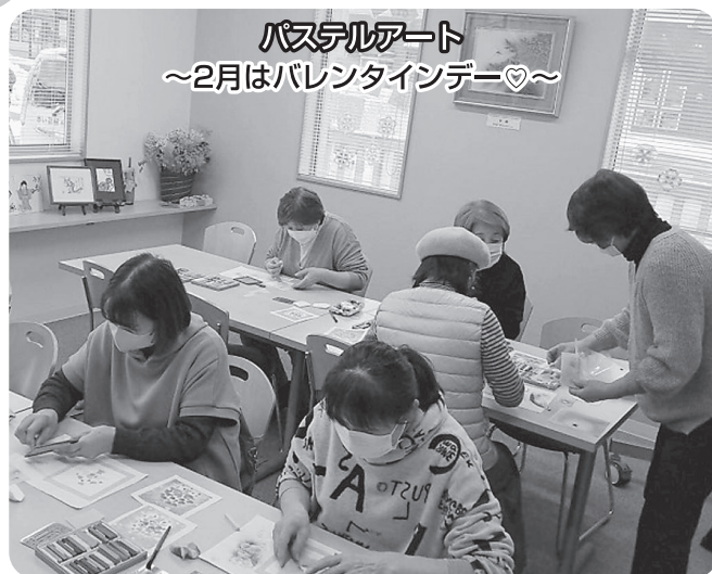
パステルアート ~2月はバレンタインデー~