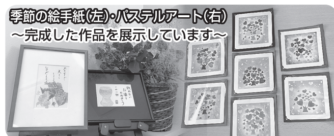
季節の絵手紙(左)・パステルアート(右) ~完成した作品を展示しています~

当会では、“みんなが利用できる、多世代交流スペースを毎週月曜～金曜(9:00～17:00)まで常時解放しています。