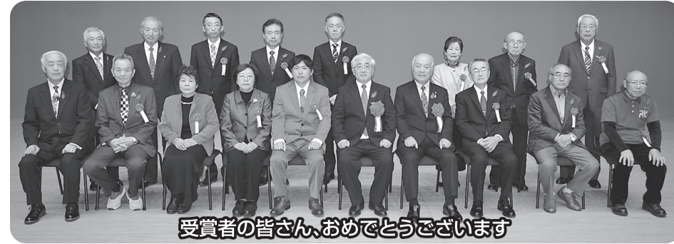
受賞者の皆さん、おめでとうございます