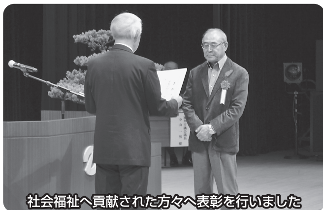
社会福祉へ貢献された方々へ表彰を行いました