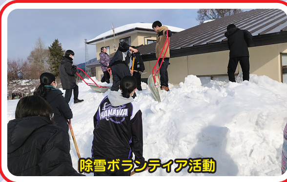
除雪ボランティア活動