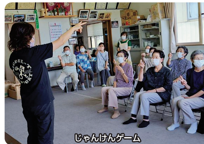
じゃんけんゲーム

今回は、十和田地区南自治会に行き、じゃんけんゲームや音楽に合わせて体操などを行い、特にじゃんけんゲームでは、負けたくないと思つと頑張っている方が多く盛り上がりを見せていました。「出張ミニサロン」は土日・祝日でも、地域の皆様の要望に応じて出向きますので、当会までご相談ください。