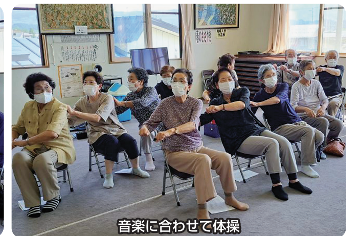
音楽に合わせて体操