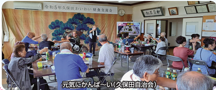
元氣にかんぱ～い(久保田自治会)