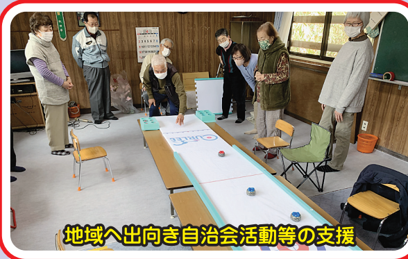
地域へ出向き自治会活動等の支援