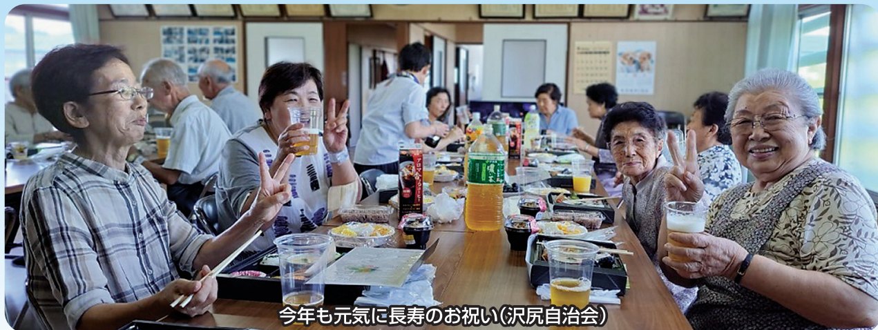
今年も元気に長寿のお祝い(沢尻自治会)

※合計34万9千818円ご寄付をいただきました。皆様から頂きましたご寄付は、当会で実施している移送サービス事業などの各種福祉事業に役立てております。皆様からのご協力に感謝いたします。