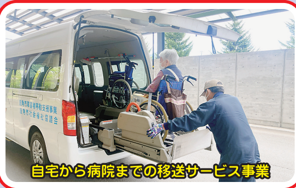
自宅から病院までの移送サービス事業