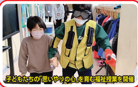
子どもたちの「思いやりの心」を育む福祉授業を開催