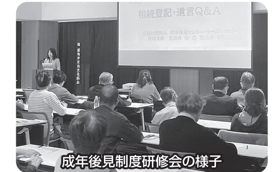
成年後見制度研修会の様子