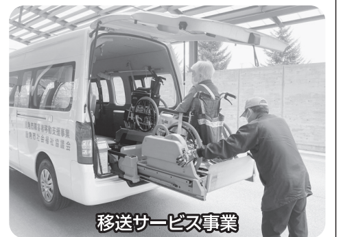
移送サービス事業