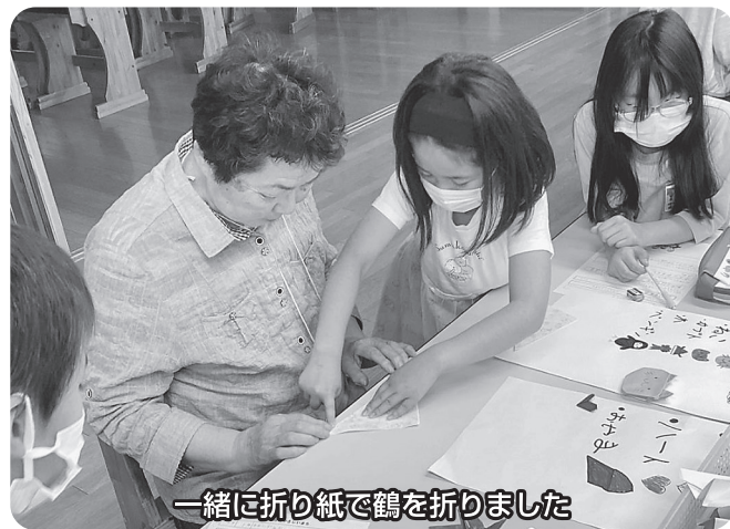
一緒に折り紙で鶴を折りました