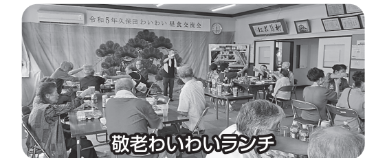
敬老わいわいランチ