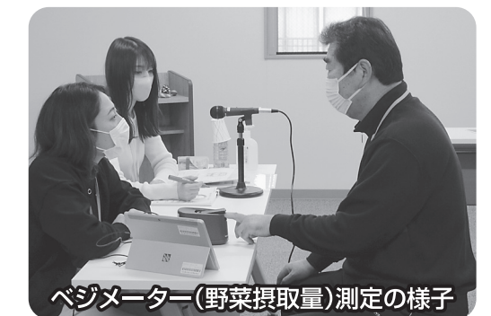
ベジメーター(野菜摂取量)測定の様子

さらに詳しい内容については、ホームページに掲載しているほか、事務局にお問い合わせください。