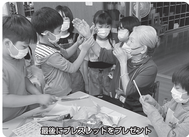
最後にプレスレットをプレゼント