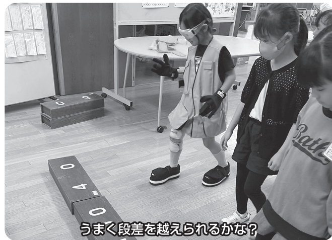
うまく段差を越えられるかな?

※合計30万円ご寄付をいただいております。 皆様から頂きましたご寄付は、当会で実施している移送サービス事業などの各種福祉事業に役立てております。皆様からのご協力に感謝いたします。