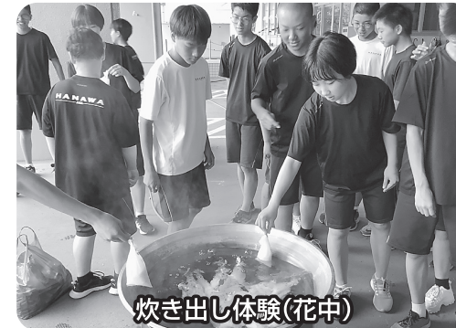
炊き出し体験(花中)