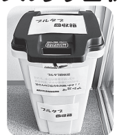
当会入口に設置しています!

▶ プルタブ回収 …当会では、環境にやさしい街づくりを目指しプルタブを回収しています。回収したプルタブを換金し、これまでに6台の車いすを購入しました。購入した車いすは、「介護機器無料貸出事業」として、在宅で生活している高齢者や障がい者などへ無償提供しています。