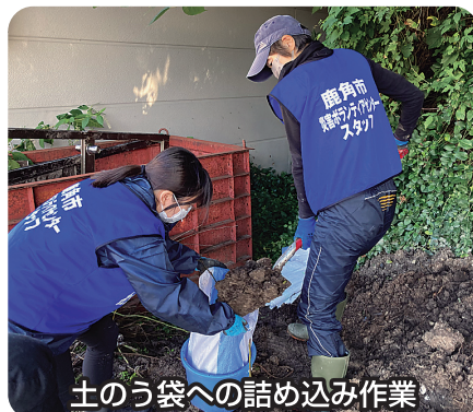
土のう袋への詰め込み作業