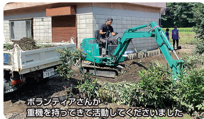
ボランティアさんが重機を持ってきて活動してくださいました