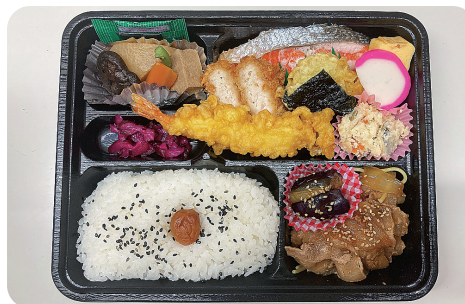
かまごやにこにこ店弁当