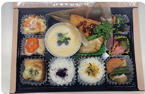
板橋仕出し店弁当