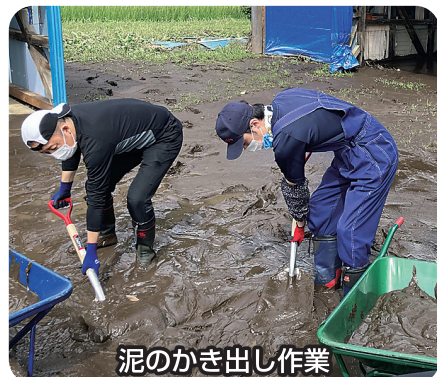
泥のかき出し作業